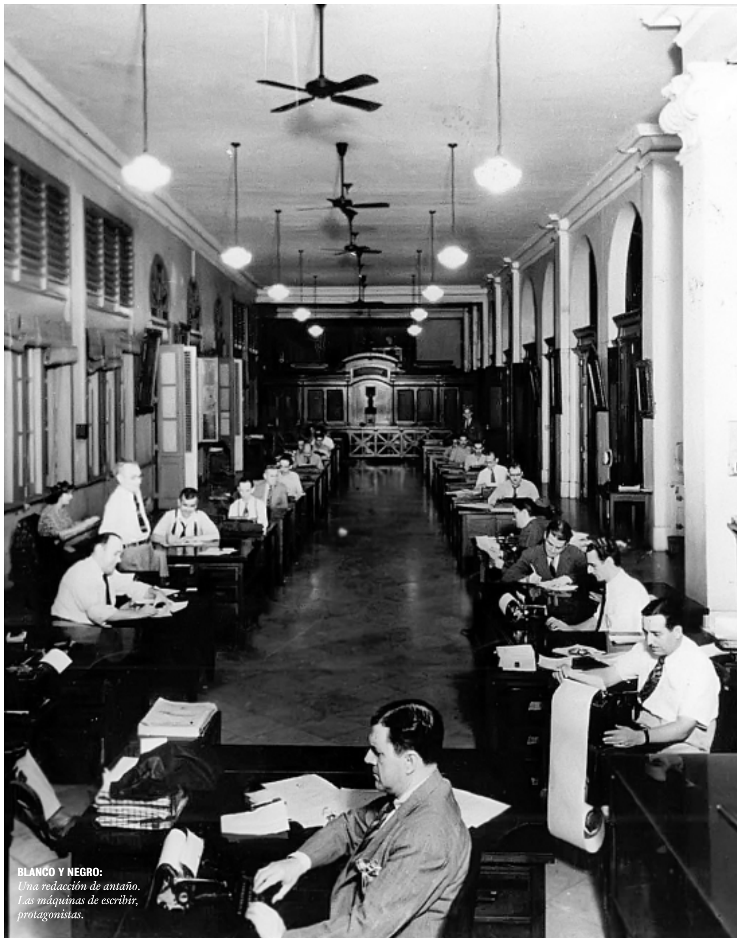
BLANCO Y NEGRO: Una redacción de antaño. Las máquinas de escribir, protagonistas.