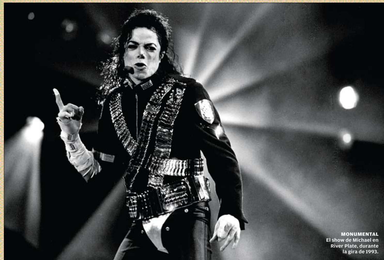
MONUMENTAL El show de Michael en River Plate, durante la gira de 1993.

Durante aproximadamente una hora, los invitados recorrieron la casa, trago en mano, como si fuera un parque de diversiones. Admiraron la nutrida colección de relojes antiguos, o la gigantesca