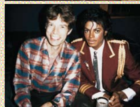
BEATLE & STONE En los comienzos de su carrera solista, en imágenes capturadas junto a Mick Jagger y Paul McCartney, dos artistas que admiraba y con los que colaboró. Con McCartney grabó "The Girl Is Mine" (en Thriller ) y, con Jagger, "State of Shock".