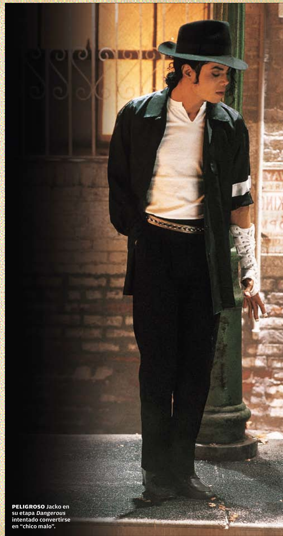
PELIGROSO Jacko en su etapa Dangerous intentado convertirse en "chico malo".

La solución que encontró Jackson fue crear un disco que apelara al público masivo, en el que la mitad de las canciones fueran copias de sus éxitos del pasado ("Heal the World" es una evidente reescritura de "We Are the World", "Who Is It" imita los pasitos de "Billie Jean", y "Black or White" recuerda a "State of